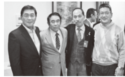
大宮司先生とラグビー部OB

※今年6月21日の同窓会に事前振り込みによる出席申し込みをされ、当日ご出席の同期方に 昨年の同期会の写真データ入りCDをお渡しする予定です。