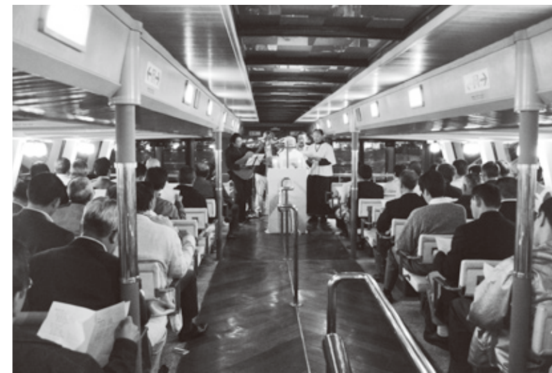
2005年5月14日 隅田川水上バスにて