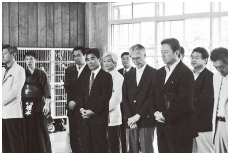
2007年6月9日 立教池袋剣道部OB会総会（剣道場に於いて）