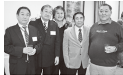
大宮司先生と柔道部OB