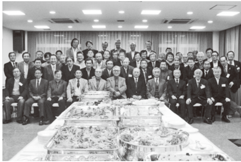
2007年11月24日 セントポール会館にて