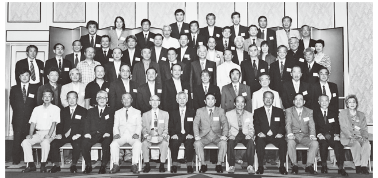
2006年9月16日 ホテルメトロポリタンにて

同窓会(広報委員会)では、同期会・クラス会・各種OB会の写真や記事を募集しております。 そのような会が開催されましたら、是非同窓会事務局(TEL 048-471-2325)へご一報下さい。