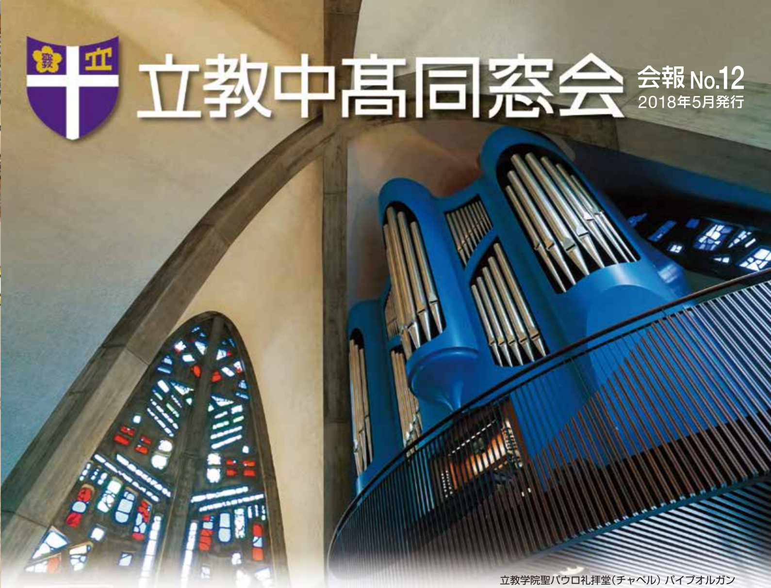
立教学院聖パウロ礼拝堂(チャペル)パイプオルガン